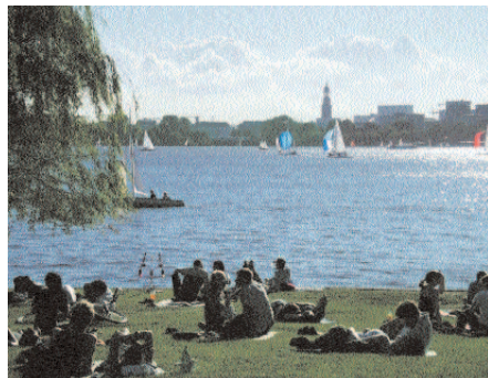
Behörde für Stadtentwicklung und Umwelt

Obwohl Hamburg über hervorragende weiche Standortfaktoren wie die vielen Freiräume am Wasser verfügt (im Bild: Blick auf die Alster), werden Institutionen, die sich mit Kunst, Kultur und Freiraum befassen nicht ins Standortmarketing einbezogen.